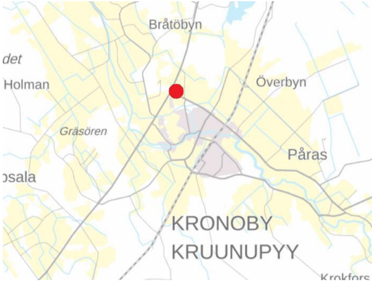
Kuva 1. Alueen seudullinen sijainti © Maanmittauslaitos.

Asemakaava-alue sijaitsee Kruunupyyn kunnanosassa Valtatie 8 ja Lentokenttätien vierässä, Lentokenttätien eteläpuolella. Alueen pinta-ala on noin 10 ha ja on kaavoitetulla alueella. Kaavoitusalueen seudullinen sijainti on osoitettu kuvassa 1 ja ohjeellinen sijainti kuvassa 2 .