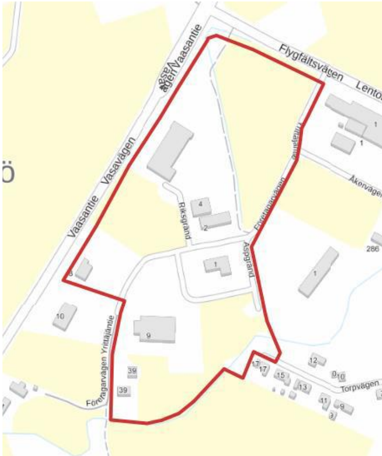
Kuva 2. Alueen ohjeellinen sijainti © Maanmittauslaitos.